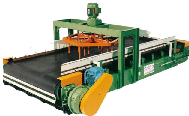
Nastro con sparpagliatore - Belt whit spreading device